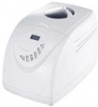
Produktfoto © Severin